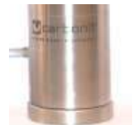
SANUNO inoxF mit Fuß

Weitere Informationen, Gutachten, Zertifikate und aktuelle Entwicklungen finden Sie im Internet unter www.carbonit.com / Mein Filter.