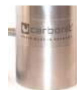
SANUNO inoxS Standard